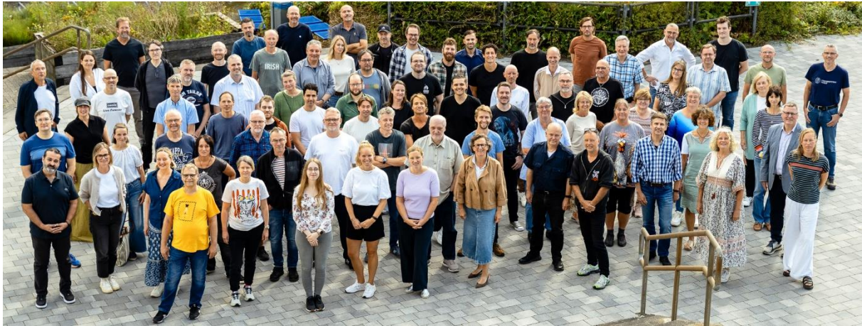
Kollegium und Mitarbeitende der BS19, September 2025